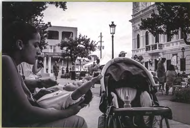
La Naturaleza sigue su curso, 2014 Ricardo Bonilla Fonseca