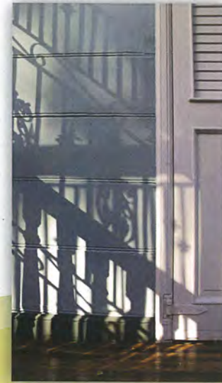
Detalle de arquitectura de la casa del Dr. Celso Barbosa, 2015 Niiza Luna