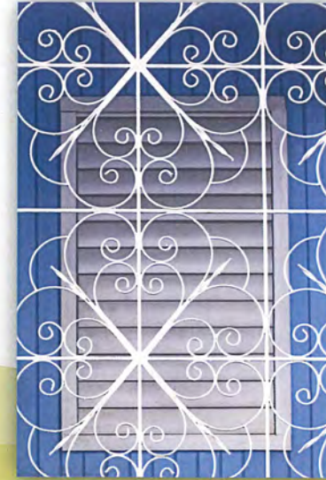
Bayamón Part 1, 2015 Rebecca Zilenziger

Le invitamos a que disfruten de esta exhibición y nos acompañen a conocer y recorrer nuestras calles para redescubrir los lugares que se han capturado detrás de diversos lentes.