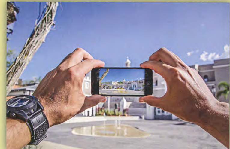
Parroquia Santa Cruz a través del lente, 2015 José Márquez