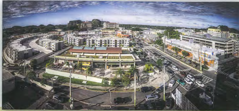
Bayamón aéreo, 2014 Rachid Molinary

Hoy, inauguramos la exhibición "Bayamón detrás del lente", producto de nuestra primera convocatoria colectiva para artistas fotógrafos. El propósito de esta exhibición es permitir que el público pueda conocer nuestra fascinante historia, el pasado y presente que coexisten en el Casco Antiguo de Bayamón, siendo el MAFO uno de los edificios que acompañan este recorrido visual.