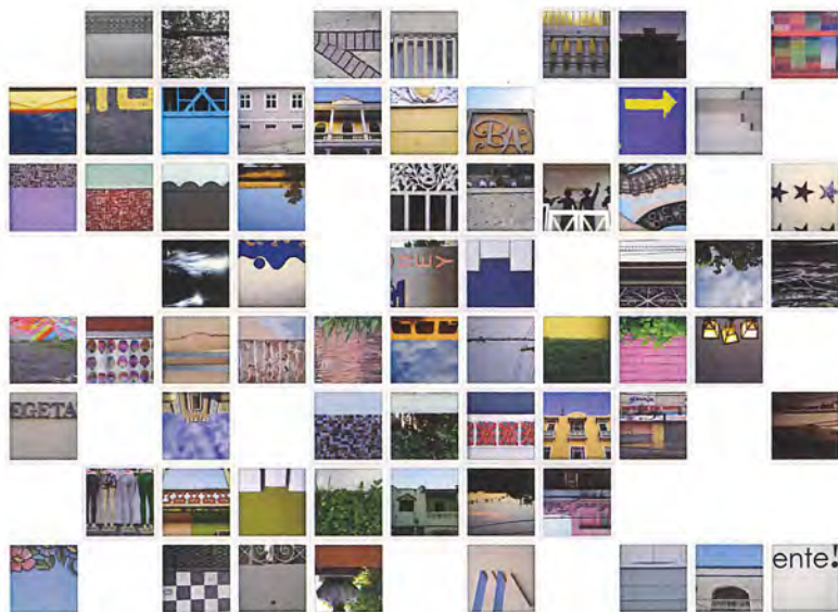
Pistas, 2015 Ángel Rafael Figueroa

En la exhibición, podrán observar algunos modelos antiguos de cámaras así como aquellos con los que estamos más familiarizados.