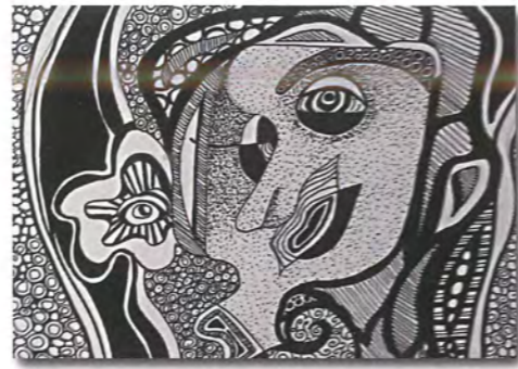
CORAZÓN DE MUJER, 2012 Tinta sobre papel. 11" X 8"