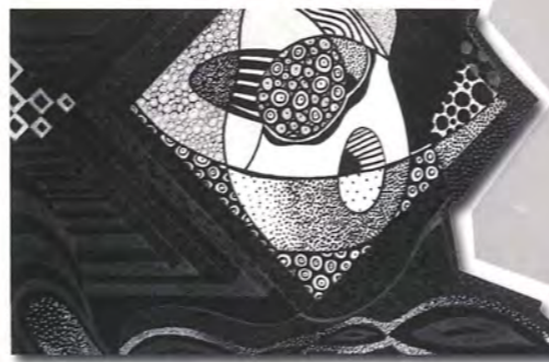
COQUILLAGE, 2012 Tinta sobre cartón de canvas 20" X 20"