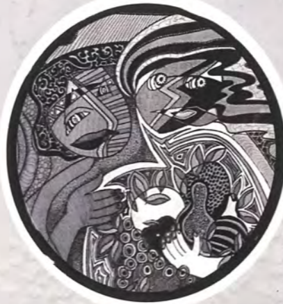
CENA ROMÁNTICA, 2013 Tinta sobre papel, 32" X 26"