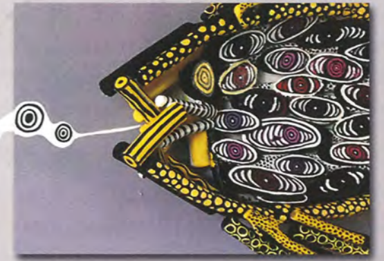
LA CARNÁ, 2013 Medio mixto, acrílico sobre canvas y madera. 72" X 12"