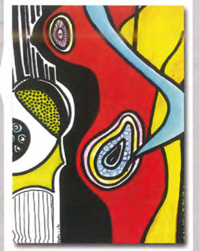
UNE MOIS, 2012 Medio Mixto, acrílico sobre canvas. 11" X 8"