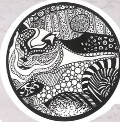
CHA CHA, 2012 Tinta sobre papel. 6" X 4.5"