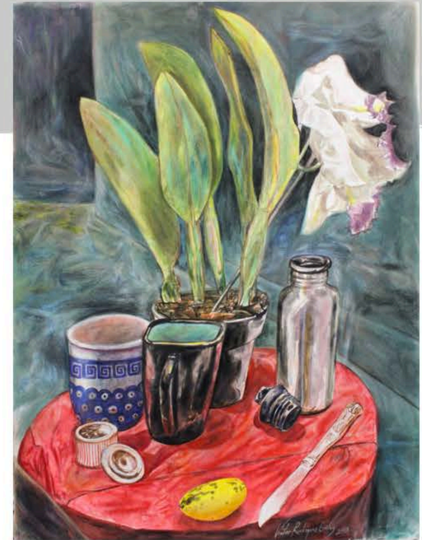
Realeza (2013) Lápiz y acuarela sobre papel 22" x 30"

Este análisis valorativo del paisaje campestre surge como reacción a la percepción general de finales del siglo XX, en el cual la pintura de paisaje rural es automáticamente relacionada con fórmulas comerciales.