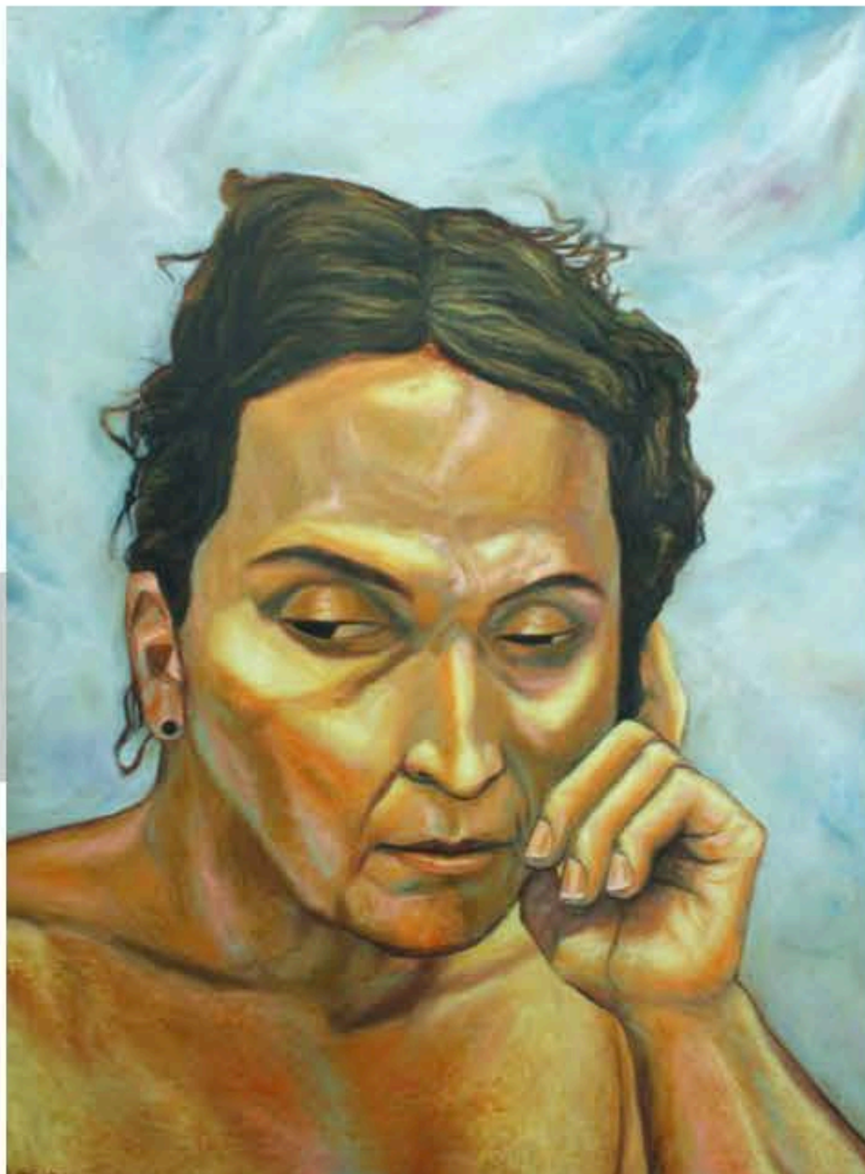
Comunicación Superior (2011) Óleo sobre lienzo 36"x 48"