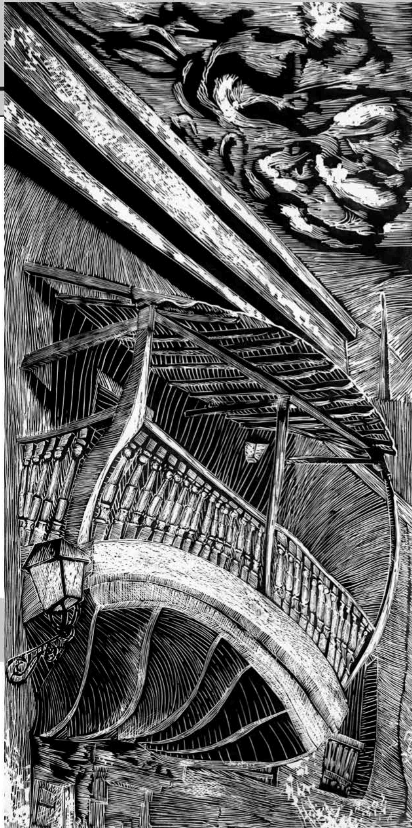
Vuelo del Espíritu (2013) 24 1/8" x 48", xilografía