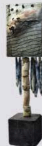
Litoral , 2016