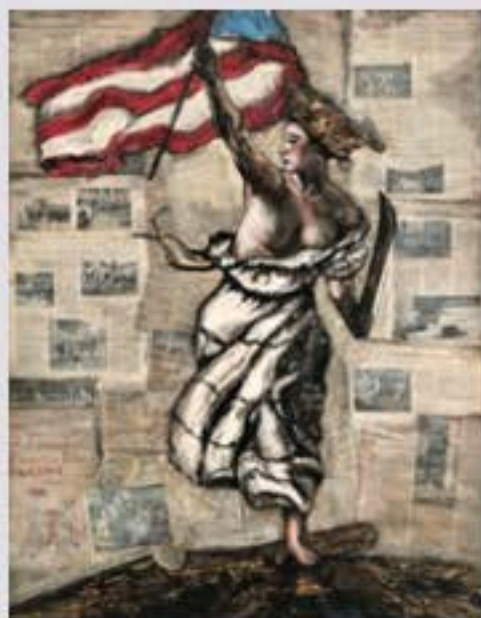
Marianne , 2019

En esta ocasión el artista puertorriqueño Gilbert Salinas nos presenta su nueva propuesta gráfica titulada Resiliencia . La misma consta de una serie de punta seca que nuestro artista maneja con gran maestría. El tema que cubre nace de su profunda preocupación por las luchas que viene librando el pueblo por la emancipación política de nuestra patria. Podemos iniciar nuestro encuentro con las obras de Salinas convencidos que habremos de entrar a una dimensión de espacio y tiempo donde encontraremos atrincherada la fuerza y dramatismo de su obra junto a la excelente calidad de su oficio. Son pocos los artistas puertorriqueños que en algún momento de su trayectoria no hayan sido seducidos por la tentación de hacer de su trabajo un instrumento de lucha.