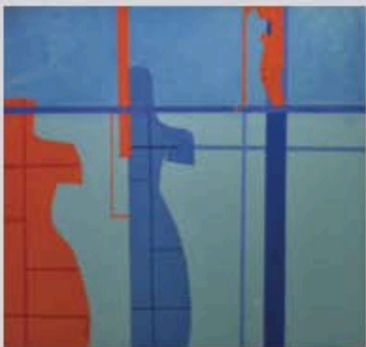
Sin título, 2012

Omar y su pintura no lineal "Una vida sin examinarse no merece ser vivida", Sócrates.