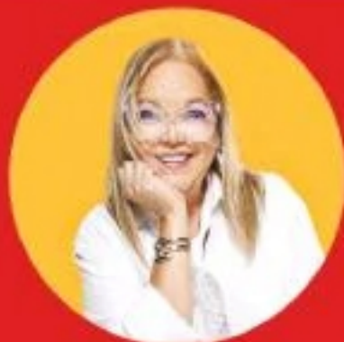
Uka Green TiTantos

Ella habla sobre todo lo que viven, sienten y opinan las mujeres de tantos años.