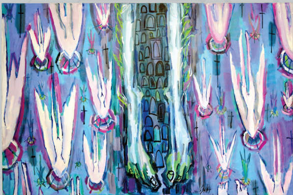
Prédica "Nichos" Cementerio Santa María Magdalena de Pazzis, 2024 Acrílico sobre lienzo

"Esta serie se enfoca en las costumbres, las tradiciones y la historia del Viejo San Juan. El proyecto consiste de una figura de aspecto críptico que siempre se encuentra apuntando hacia "el cielo". El nombre de nuestra capital me brindó la idea de su aspecto físico así como de la personalidad que encarnaría el tema."