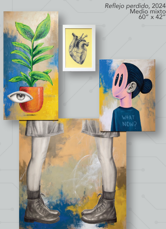
Reflejo perdido, 2024 Medio mixto 60" x 42"